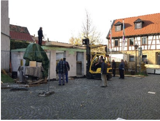
Backesbube beim Abladen des Gebälks