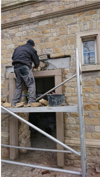
Durchbruch für die neue Tür zum Mehrgenerationenraum