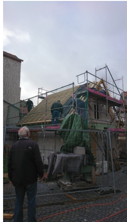
Toilettenanlage am Backes