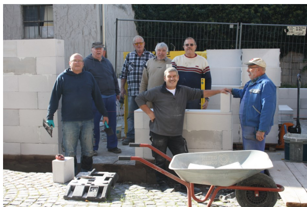
Das Team vom Bau