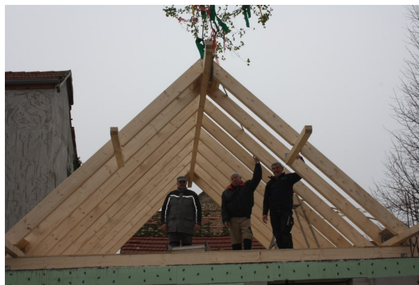
Unter dem Richtbaum