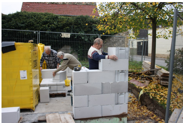
Es geht nach oben