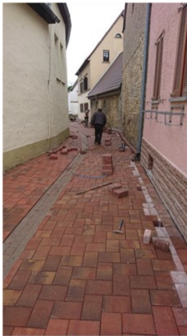
Neues Pflaster in der Rathausstraße