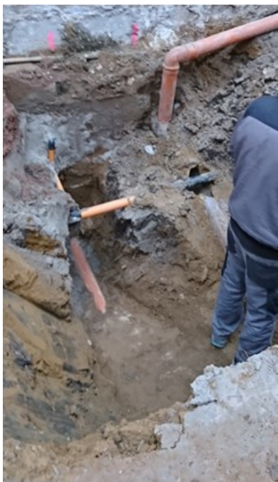
Defekter Kanal in der Kirchstraße

Der in der September-Sitzung 2019 beschlossene Ausbau der Stichwege Kirchstraße und Rathausstraße wurde im Oktober begonnen und wird bis Weihnachten abgeschlossen sein. Die Kanal- und Straßenbauarbeiten wurden an die Firma OKM Straßen- und Tiefbau GmbH aus Mannheim vergeben. Die Arbeiten waren dringend notwendig und aufgrund der vorhandenen Bausubstanz nicht einfach. Umso erfreulicher dass die Maßnahme zügig und erfolgreich vor dem Winter abgeschlossen sein wird.